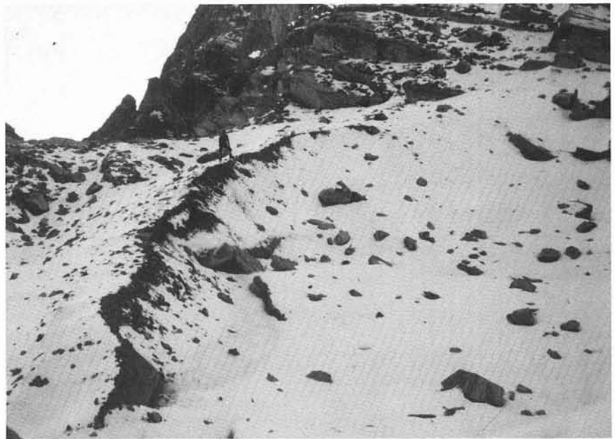
FIG. 3 - Porzione distale del ghiacciaio, lunga circa 30 m e alta 2-3 m, rimasta integra in posto simulando un arco morenico frontale.