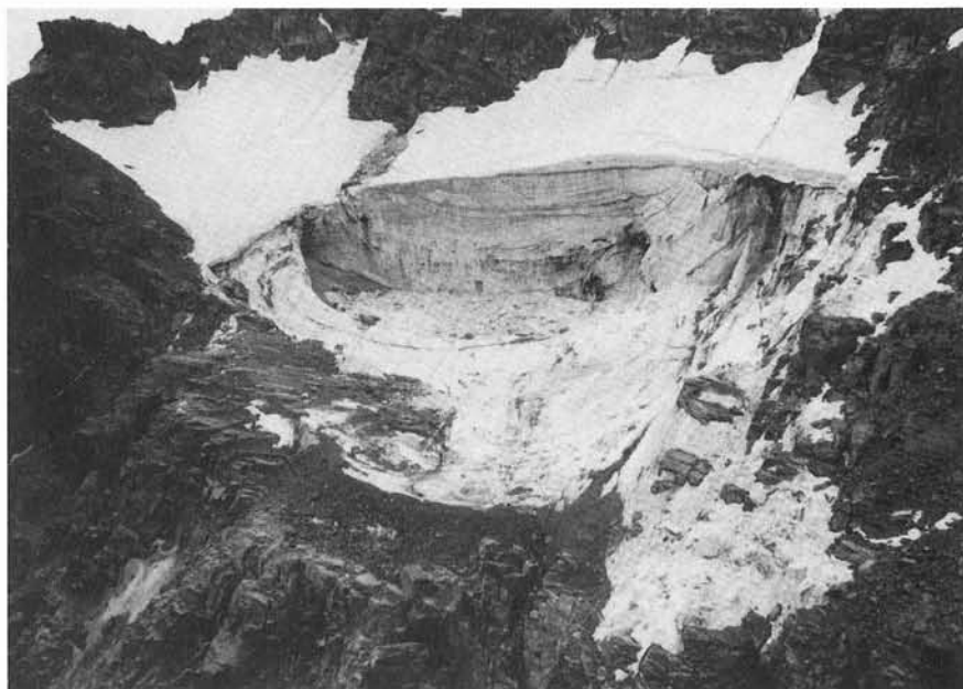
FIG. 1. - Il Ghiacciaio Superiore di Coolidge qualche giorno dopo il crollo che ha coinvolto una massa cuneiforme larga 150 m, lunga 120 m e con spessore massimo di circa 35 m.

di quota (10-15 m per il ghiacciaio Inferiore di Coolidge) tra la cresta degli apparati morenici e l'attuale superficie dei ghiacciai. Significativo a questo proposito è stata la ricostruzione dell'evoluzione del Ghiacciaio Superiore di Coolidge nell'ultimo secolo (fig. 4) attraverso il confronto